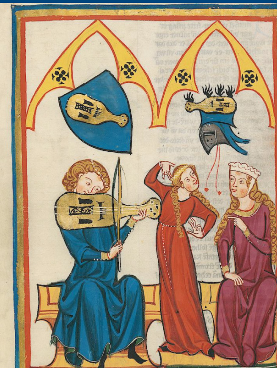
Spieleute am Hof; Cod. Pal. germ 848, 312 r

Mediävistisches Nachwuchs-Kolloquium der Universitäten Bamberg, Bayreuth, Gießen, Chemnitz, Karlsruhe und Braunschweig