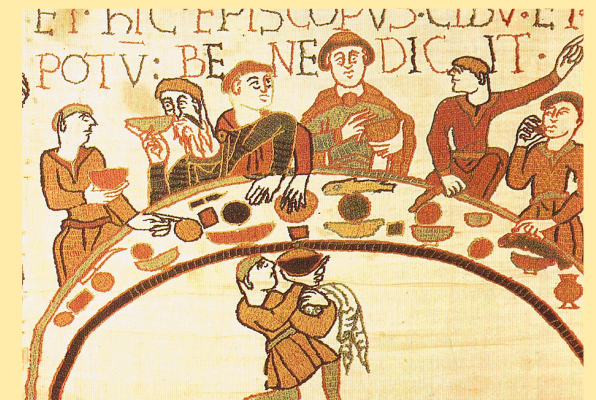
Das Festmahl Wilhelm des Eroberers, Ausschnitt aus dem Teppich von Bayeux aus der 2. Hälfte des 11. Jh.