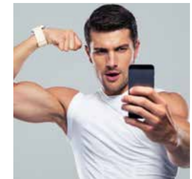
Narziss, der sich in sein Spiegelbild verliebte, und seine moderne Entsprechung. Erziehen wir auch unsere Kinder zu Narzisten?

Gerade in individualistischen Kulturen, in denen Narzissmus in stärkerem Maße als in kollektivistischen Kulturen beobachtet wird, überhöht man Kinder bisweilen als ‚Superstar‘, ‚Princess‘ oder ‚Boss‘. Weitere Faktoren, die Narzissmus begünstigen, sind hohes Einkommen der Eltern und das Aufwachsen als Einzelkind. Wenn Eltern ihren Kindern vermitteln, sie seien besser als andere, fördert dies überhöhte Selbsteinschätzungen; und wenn Kinder keine Grenzen erfahren, kann das rücksichtslose Verhalten begünstigen.