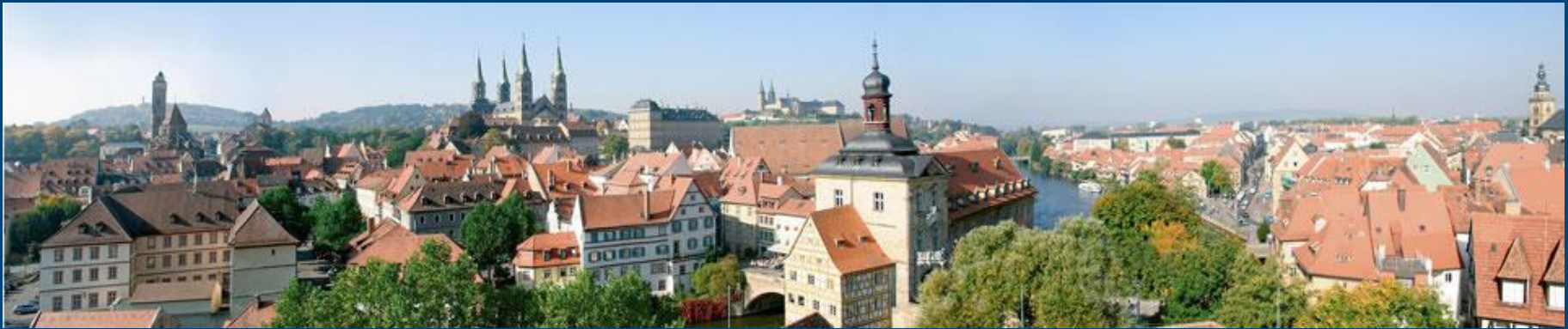
Panorama über die Bamberger Innenstadt