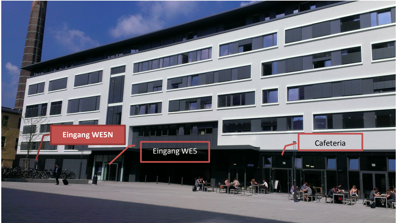
Bild vom Innenhof