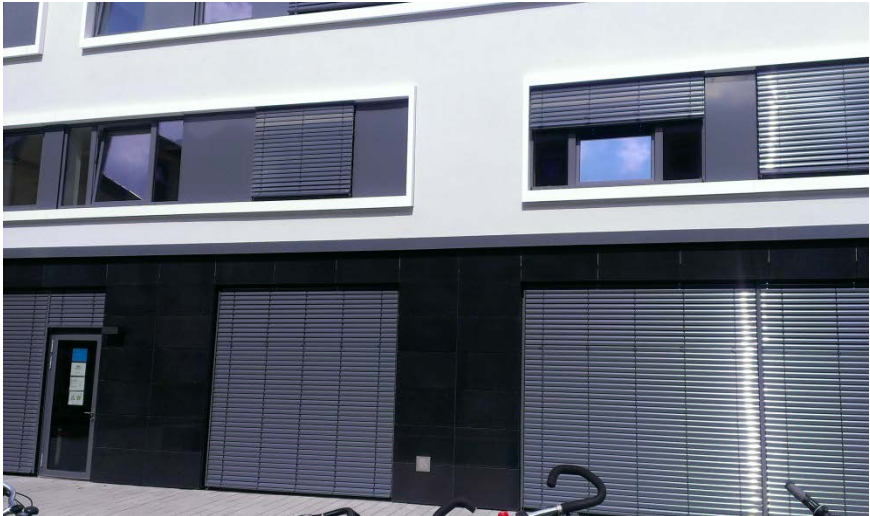
Von den Fahrradständern aus betrachtet