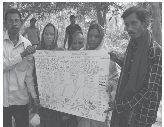
Fig. 2: Anti-Bhopalpatnam dam rally, Hemalkasa, Maharashtra