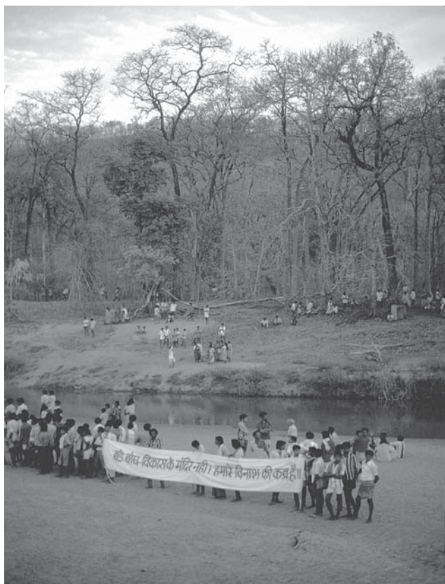
Fig. 1: Akhupadar village CFR exercise, Odisha

Money may remain an important medium of exchange, but would be much more locally controlled and managed rather than controlled anonymously by international financial institutions and the abstract forces of global capital operating through globally networked financial markets. Considerable local trade could revert to locally designed currencies or barter, and prices of products and services even when expressed in money terms could be decided between givers and receivers rather than by an