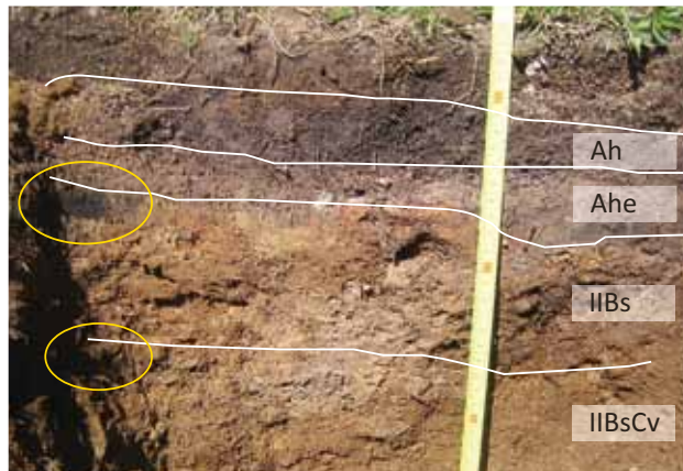
Abb. 4: Braunpodsol (2160 m ü. M.) mit Holzkohle (orange markiert).

Über das Alter des Bodens kann hier aufgrund von nicht vorhandenen Datierungen (in Planung) nur spekuliert werden. In der Regel bilden sich Podsole in den Zentralalpen mit sandigem Ausgangsmaterial in meist mehr als 350 Jahren (Röpke 2011). Veit (2002) geht bei Podsole auf Moränen auf silikatischem