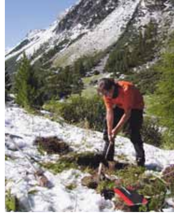
Abb. 2: Entnahme einer Bodenprobe im Fimbertal im Sommer 2011.

Nach den Sondierungen wurden Bodenprofile an 14 verschiedenen Standorten zwischen 1850 m ü. M. (subalpine Stufe) und 2540 m ü. M. (alpine Stufe) angelegt (Abb. 1). Die Ansprache der Böden wurde mit Hilfe der Bodenkundlichen Kartieranleitung (2005) durchgeführt. Neben der Bestimmung von bodenkund-