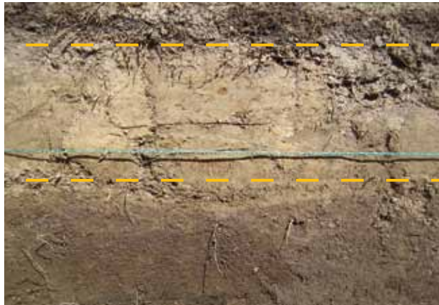
Abb. 5: Profil der Ausgrabung «Eisenzeitliche Hütte» mit heller Ablagerung.

Neben den beschriebenen Bodentypen finden sich im Fimbertal wie erwartet auch kolluvial geprägte Böden unter Stauwasserfluss (Kolluvisol-Pseudogley) am Fusse steiler Hanglagen. Im hinteren Fimbertal auf 2540 m ü. M. gibt es flache, stark sandige Braunerden, deren Korngrössenverteilung (73% Sand, davon