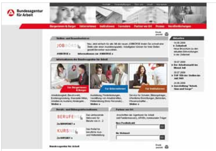
Screenshot Startseite www.arbeitsagentur.de

dertenvertretungen – eine wichtige Hilfe bei der Vorbereitung einer Bewerbung. Namen und Adresse der Vertrauenspersonen der schwerbehinderten Beschäftigten ( Schwerbehindertenvertretung ) sowie der Gleichstellungsbeauftragten erfragt man leicht über die jeweilige zentrale Rufnummer. Zur begrifflichen Klarheit sei noch auf die Funktion „ Bbeauftragte(r) für Schwerbehinderte “ hingewiesen. Dabei handelt es sich meist um Mitarbeiter der Personalabteilung, also nicht um die Interessenvertretung der schwerbehinderten Beschäftigten.