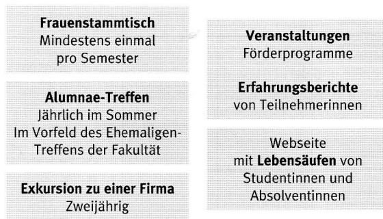
Abbildung 2: Unterstützung von Studentinnen an der Fakultät WIAI

anderem, dass Frauen in den informatiklastigeren Studiengängen durchweg eine überdurchschnittlich gute Abiturnote im Fach Mathematik aufweisen, während das für Studenten und weniger informatiklastige Studiengänge nicht der Fall ist. Zudem schätzen Studentinnen in informatiklastigen Studiengängen ihren Studienerfolg schlechter ein als Studenten und Studierende aus weniger informatiklastigen Studiengängen obwohl dies objektiv nicht der Fall ist. Mit dem letztgenannten Befund kann beispielhaft illustriert werden, welchen Vorteil eine standortbezogene Empirie haben kann: Erst nachdem die Auswertung ergab, dass Studentinnen ihren Studienerfolg schlechter bewerten als Studenten, haben wir versucht, diese subjektive Einschätzung mit objektiven Zahlen zu überprüfen. Auf Nachfrage bei dem für das zentrale Informatikmodul der beiden ersten Semester verantwortlichen Kollegen, erklärte dieser sich bereit, uns die Klausurergebnisse anonymisiert und mit Geschlecht kodiert zur Verfügung zu stellen.