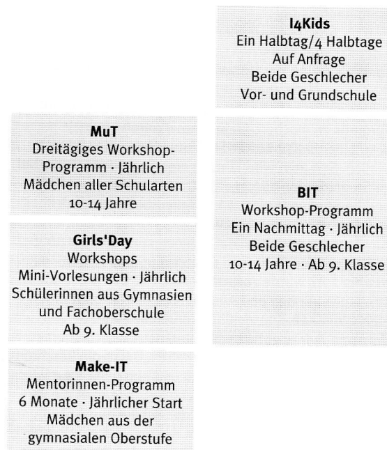
Abbildung 1: Maßnahmen für Schülerinnen an der Fakultät WIAI

Diese Entwicklung zeigt sich auch an den anderen MuT Standorten in vergleichbarer Weise. Weitere Maßnahmen