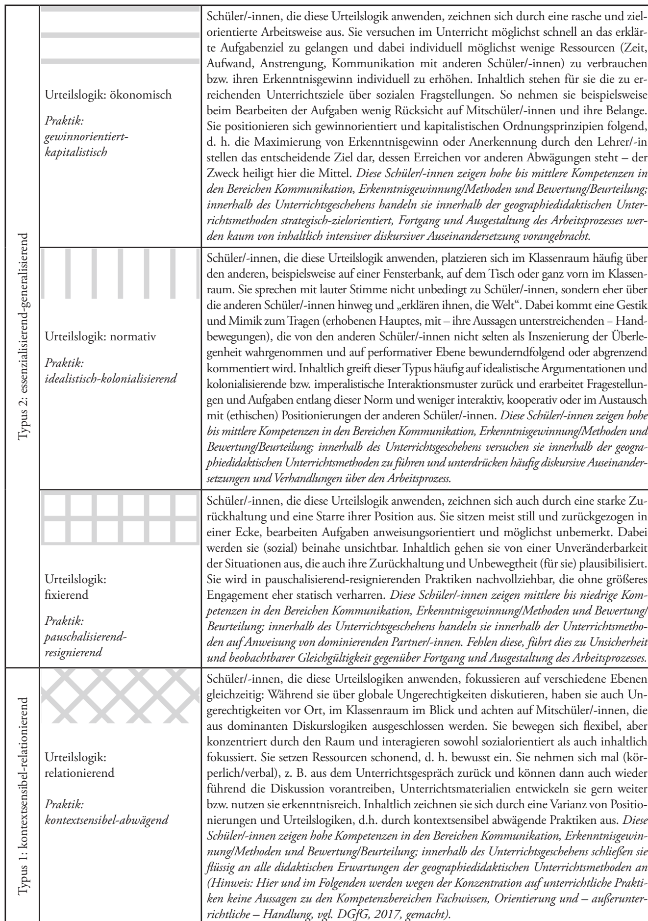
Abb. 3: Praktiken ethischen Urteilens im Kontext geographiedidaktischer Ansätze