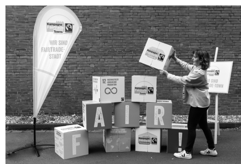
Abb. 1: Von New York bis Hallig Hooge – Fairtrade Towns

Stadt bzw. der (Hoch-)Schule zum fairen Handel, organisiert Bildungsprojekte, Veranstaltungen und Aktionen und kümmert sich um Öffentlichkeitsarbeit. Die Vernetzung in Fairtrade-Towns trägt dazu bei, die Beschaffung von Konsumgütern fairer zu gestalten. Die Umstellung beginnt zumeist mit fairem Kaffee oder Tee in Rathäusern und wird dann häufig kontinuierlich ausgebaut, z. B. auf Fairtrade-Blumen oder Präsentkörbe als Geschenke oder gar auf die Ausstattung der städtischen Betriebe: Die Stadt Würzburg etwa beschafft die Berufsbekleidung der Stadtreinigung nach fairen Kriterien.