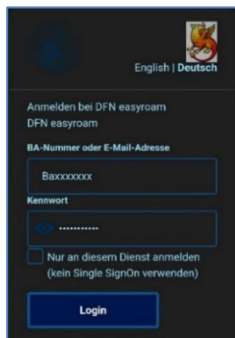
Abbildung 3: Shibboleth Login

Nachdem Sie die App geöffnet haben, tippen Sie auf Mit Browser anmelden . Geben Sie im Suchfeld Bamberg ein und wählen Sie die Universität Bamberg aus.