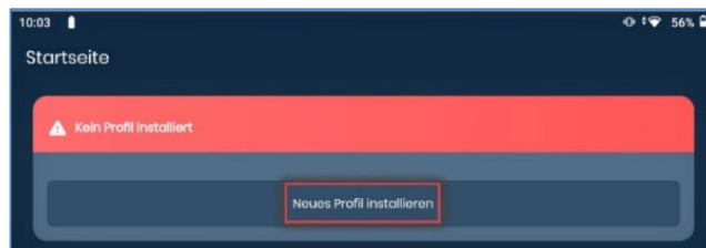
Abbildung 4: easyroam Profil installieren

Geben Sie im nächsten Schritt (Shibboleth-Login) Ihre BA-Nummer und das dazugehörige Kennwort ein. Lesen und akzeptieren Sie die Einverständniserklärung auf der nächsten Seite. Lesen Sie die Datenschutzhinweise und klicken Sie auf Informationen übertragen.