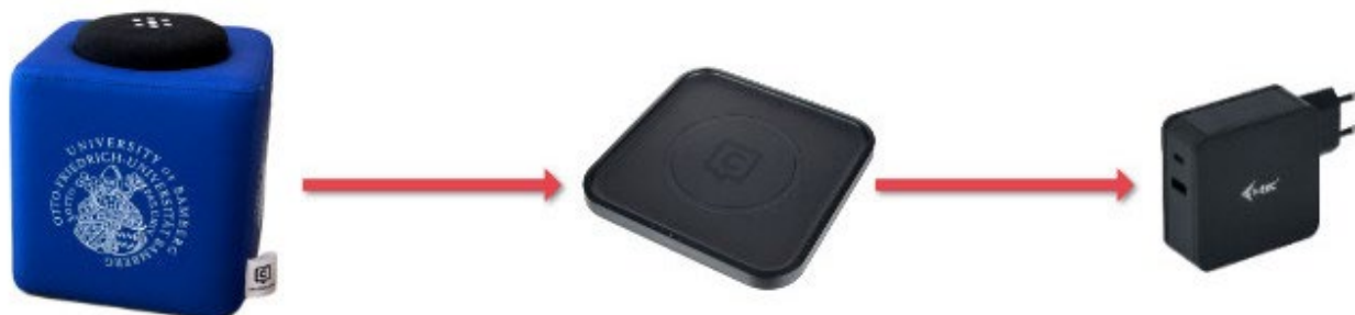
Abbildung 2 – Optional: Aufbau und Anschluss der Ladestation