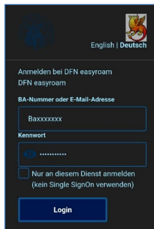
Abbildung 4: Shibboleth Login

Geben Sie im nächsten Schritt, beim Shibboleth-Login, Ihre BA-Nummer und das dazugehörige Kennwort ein.