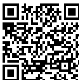
Abbildung 1: QR-Code geteduroam App

Laden Sie die App geteduroam im Google Play Store herunter und installieren Sie diese. Die App wird ab Android 8 (Oreo) unterstützt. Zum Download können Sie das WLAN-Netz @BayernWLAN oder die mobilen Daten nutzen.