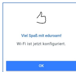
Abbildung 5: Einrichtung eduroam abgeschlossen

Jetzt wird das Zertifikat automatisch installiert. Nach erfolgreichem Abschluss, erscheint die Meldung: Viel Spaß mit eduroam! WiFi ist jetzt konfiguriert.