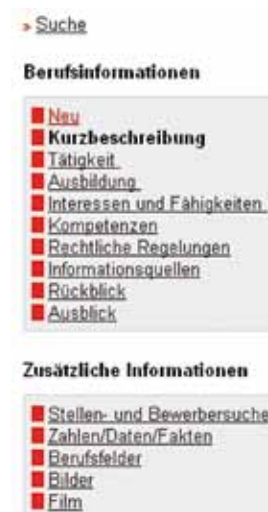
Screenshot Inhaltsübersicht - "BerufeNet"

„ BERUFENET “ enthält zu Ihrem Beruf eine aktuelle und hilfreiche Übersicht einschlägiger Stellen- und Bewerberbörsen.