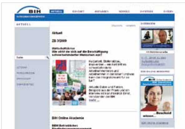
Screenshot Startseite www.integrationsaemter.de

Mit dem Wandel des Selbstverständnisses behinderter Menschen erfolgte ein Paradigmenwechsel vom Objekt der Versorgung zum Menschen in einem selbstbestimmten Alltag. An die Stelle fremdbestimmter Fürsorge tritt Teilhabe und Selbstbestimmung. Im Neunten Buch Sozialgesetzbuch (SGB IX) erfolgte eine Stärkung der individuellen Rechtsposition und der Ausbau der Wunsch- und Wahlrechte – auch unter Beachtung des Grundsatzes „ambulant vor stationär“ Leistungen „wie aus einer Hand“ werden als „persönliches Budget“ koordiniert durch die Servicestellen möglich.