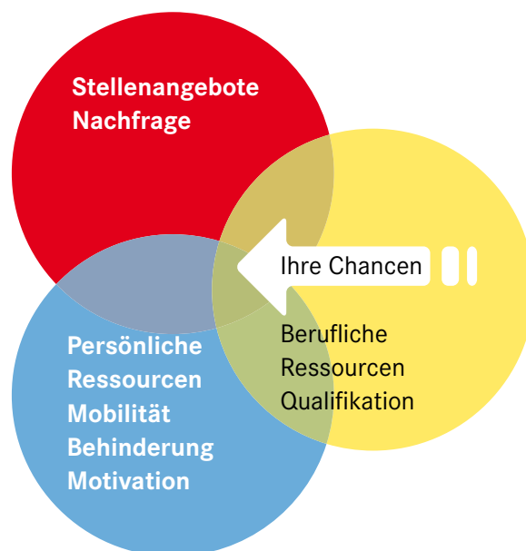
Diagramm Chanceneinschätzung Nachfrage, Ressourcen, Behinderung

Der Anteil von Absolventen und Absolventinnen mit anerkannter Schwerbehinderung liegt lediglich bei etwa 0,5 Prozent. Allerdings verweisen im Rahmen der Sozialerhebung des Deutschen Studentenwerks 21 Prozent der Studierenden auf mittlere oder starke gesundheitliche Beeinträchtigungen im Studium.